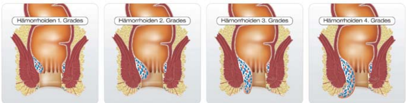
Abbildung 1: Stadieneinteilung der Hämorrhoidalerkrankungen

Die auf Hämorrhoiden zurückzuführenden Beschwerden sind uncharakteristisch und auch bei vielen anderen proktologischen Erkrankungen ähnlich vorhanden (Tab. 1). Sie sind nicht von der Größe der Hämorrhoiden abhängig. Das häufigste Symptom ist die anale Blutung. Bei